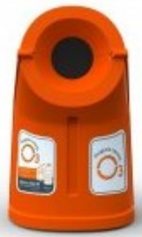
A CERCIGUI tem depósito para recolha de óleos alimentares